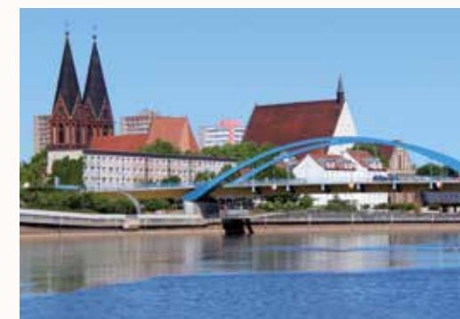
Most na Odrze – Widok ze Słubic na Frankfurt nad Odrą

Zadania i sposób funkcjonowania Komitetu Monitorującego zostały ustalone w regulaminie tego organu. Lista członków Komitetu Monitorującego jest dostępna na stronie internetowej: http://interregva-bb-pl.eu/begleitausschuss/mitglieder-des-begleitausschusses/ .