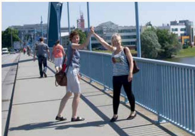
Grenzübergang Frankfurt (Oder)–Słubice

Stowarzyszenie Gmin RP Euroregion „Spree-Nysa-Bóbr“ ul. Piastowska 18 66-620 Gubin Tel.: +48 (0) 684 558 050 Fax: +48 (0) 684 558 050 E-Mail: info@euroregion-snb.pl www.euroregion-snb.pl