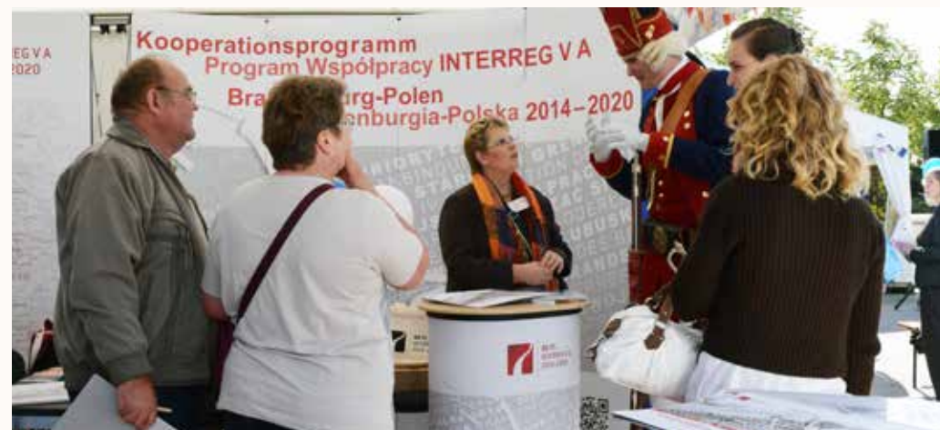
Das Kooperationsprogramm stellt sich in Potsdam vor

Stand: Februar 2017 Layout: ariadne an der spree GmbH www.ariadneanderspree.de Druck: Blueprint Berlin GmbH Auflage: 500 Exemplare