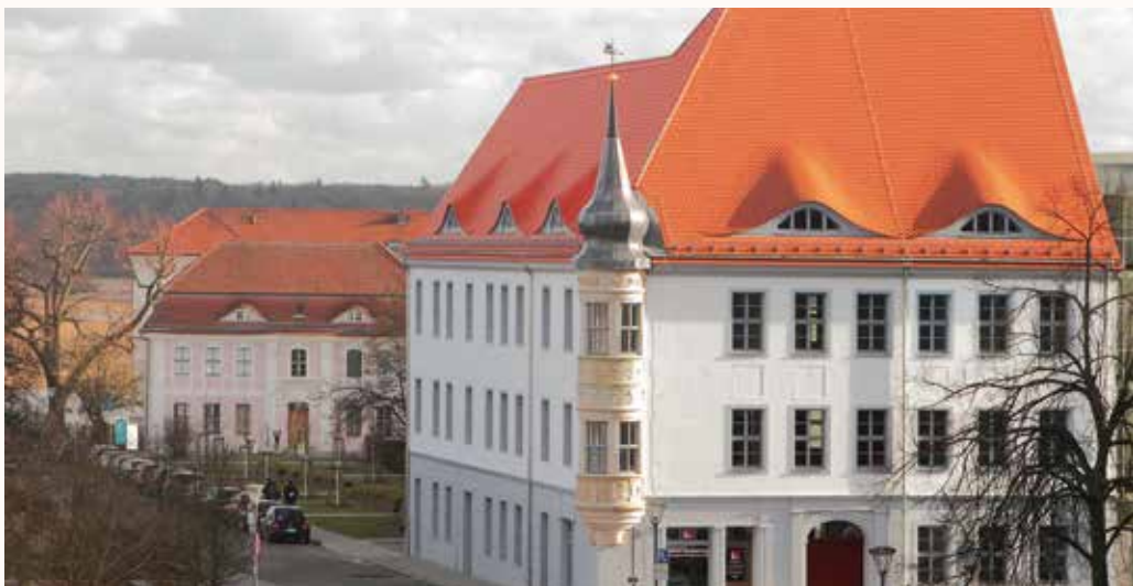
Das Gemeinsame Sekretariat im Bolfrashaus in Frankfurt (Oder)

Im Ergebnis konnten bis Ende 2016 für sämtliche Prioritätsachsen Projektaufträge gestartet werden: