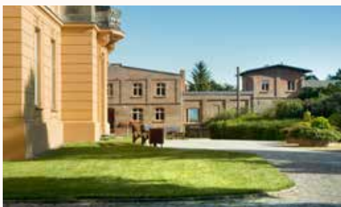
Schloß Trebnitz Bildungs- und Begegnungszentrum e.V.

Weitere Informationen finden sich im Förderhandbuch. Das Förderhandbuch zur Umsetzung des Kooperationsprogramms INTERREG V A Brandenburg – Polen 2014-2020 richtet sich insbesondere an die potentiellen Antragsteller und Begünstigten des Programms. Es beschreibt den rechtlichen Rahmen, die Programmgrundsätze und -inhalte, die Verfahren zur