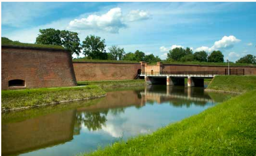
Die Festung in Kostrzyn an der Oder nach der Revitalisierung

Aktive Unterstützung in allen Förderfragen und weitere Informationen bieten somit das Gemeinsame Sekretariat in Frankfurt (Oder) und die Regionale Kontaktstelle in Zielona Góra.