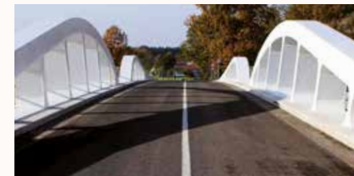
Brücke Zary – Zagań

auf einem auf der Programmhpage abrufbaren Formular die Projektskizze in elektronischer Form an das Gemeinsame Sekretariat übersandt werden. Innerhalb von maximal 10 Arbeitstagen nach Erhalt der Skizze nimmt das Gemeinsame Sekretariat Kontakt mit den Antragstellern auf und verabredet das weitere Verfahren. Die Konsultation kann elektronisch, telefonisch oder am Sitz des Gemeinsamen Sekretariates bzw. der Regionalen Kontaktstelle erfolgen. Es wird empfohlen, entsprechend früh, vor dem geplanten Abschluss des Aufrufs, die Projektskizze an das Gemeinsame Sekretariat zu senden, um einen optimalen Nutzen aus der Beratung zu ziehen. Seit der Arbeitsaufnahme des Gemeinsamen Sekretariates und der Regionalen Kontaktstelle wurden 181 Beratungsgespräche durchgeführt.