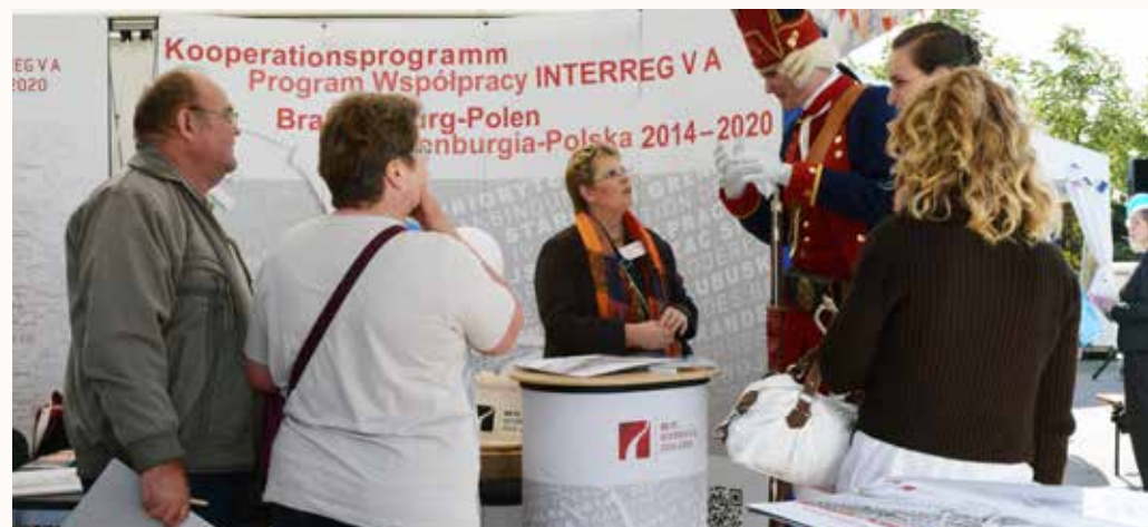
Prezentacja Programu Współpracy w Poczdamie