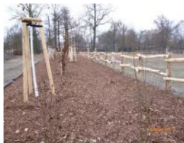
Branitz 1 (Piaſtowski) EFRE: 578.511,18 EUR