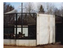
Budowa Mini Zoo w Zielonej Górze (Budynek dla drapieżników w Cottbus) EFRR: 192.182,08 EUR