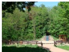
Lasek i Park Piastowski (Park Branitz) EFRR: 578.511,18 EUR