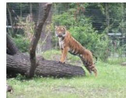
Raubtierhaus (Minizoo in Zielona Góra) EFRE: 1.191.638,00 EUR