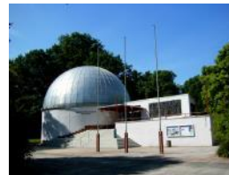
Modernizacja planetarium w Cottbus