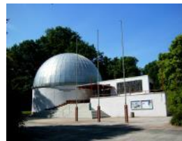
Modernisierung Planetarium (Fulldomeprojektions- anlage) EFRE: 722.450,00 EUR